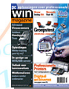
WinMagazine „Scan and Sort it zur vollsten Zufriedenheit“