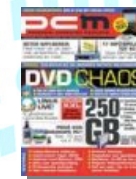
PCM „Scan and Sort it erfüllt die Erwartungen“