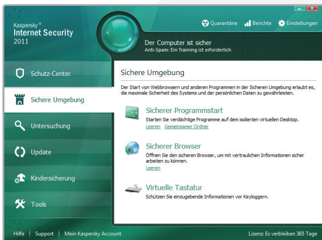
Hauptmenü von Kaspersky Internet Security 2011

Eugene Kaspersky, Kaspersky Lab CEO & Firmengründer