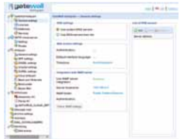
GateWall Antispam Administrator-Konsole

Die Auswirkungen von Kommunikations- und Web-Bedrohungen, Osterman Research